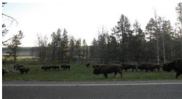
野生動物を間近で観察

観光客が豊かな自然を体験するための施設やプログラムを提供。運営費の一部は、入場料やコンセッション料で充当。