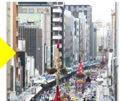
屋外広告物の適正化が進んだ四条大通 (2007年 → 2015年)