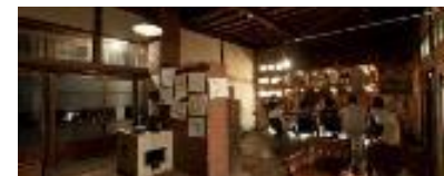
廃業した旅館や飲食店舗をリノベーション