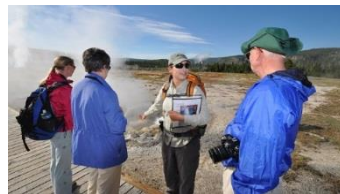
専門家によるガイドツアー