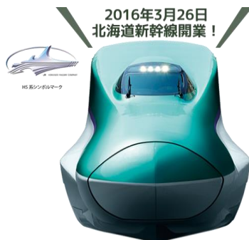
北海道新幹線の開業

「ジャパン・レールパス」を訪日後でも購入可能化。 また、新幹線開業やコンセクション空港運営等と連動 した、観光地へのアクセス交通の充実を実現。