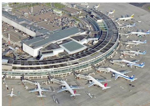
複数空港の一体運営（新千歳）