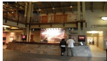
ビジターセンターでの旅行案内