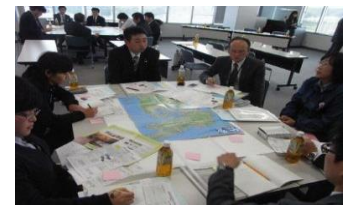
地域協議会の様子